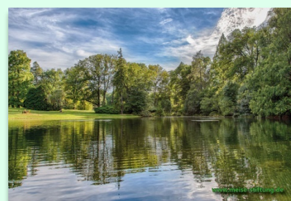
Motiv 2 „Waldsee“

_____ (Menge) Postkartenständer (Plexiglas)