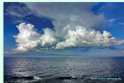
Motiv 1 „Meer“

Unsere Postkarten wurden ökologisch und umweltschonend gedruckt und haben eine dementsprechende Zertifizierung. Für die Auslage unserer Postkarten erhalten Sie auch mehr Exemplare kostenlos, der Versand ist kostenfrei!